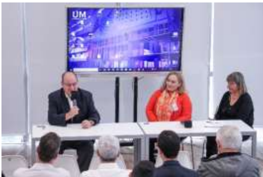
Acto de inauguración